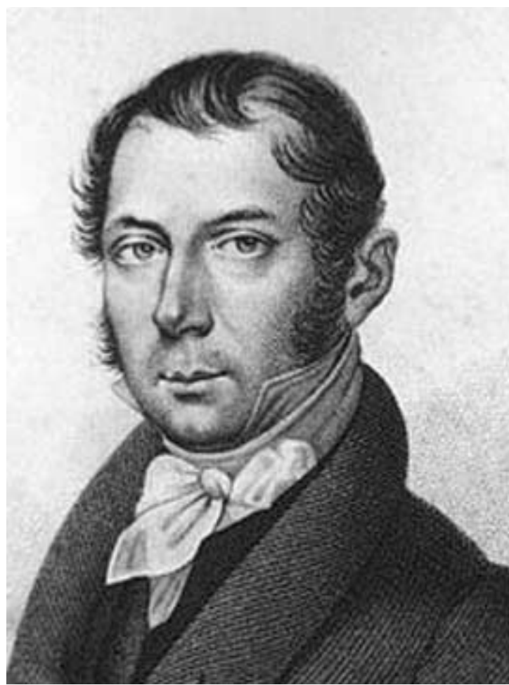
RETRATO DE LOUIS CORDIER.

Sin embargo, si alguien emprendiera algún día la historia de la geología canaria —lo que no es, ni mucho menos, nuestro propósito— sin lugar a dudas tendría que iniciar su recorrido con Louis Cordier, “el primer visitante científico de la modernidad” en palabras de otro ilustre viajero, el británico Richard F. Burton, y a quien todos los geólogos antes citados no dejan de