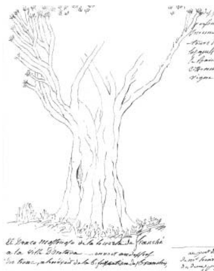
El draco monstruoso de la huerta de Franchi a la villa de Franchi... un draco monstruoso... un draco monstruoso...

En ambas cartas se puede apreciar, además de un cuidado estilo (del que ya había dado muestras en su etapa estudiantil), una notable sensibilidad que el joven Cordier sabe compaginar con la exposición precisa de sus análisis y observaciones. El espíritu romántico que empieza a contagiarse en Francia en este principio de siglo ya se hace patente en las razones que mueven a Cordier a desplazarse a una isla en la que confluyen el bagaje mítico y el interés científico: “Me quedaba por visitar uno de esos santuarios donde [la naturaleza] ha permanecido en cierto modo relegada después de haber terminado su obra y en la que su actividad se despierta de vez en cuando y da suficientes pruebas de su existencia para provocar el espanto y la desolación [...] La esperanza de obtener algunas ideas sobre la Atlántida me ha convencido: sólo desde el Pico de Tenerife podría atreverme a hacer algún tipo de con-